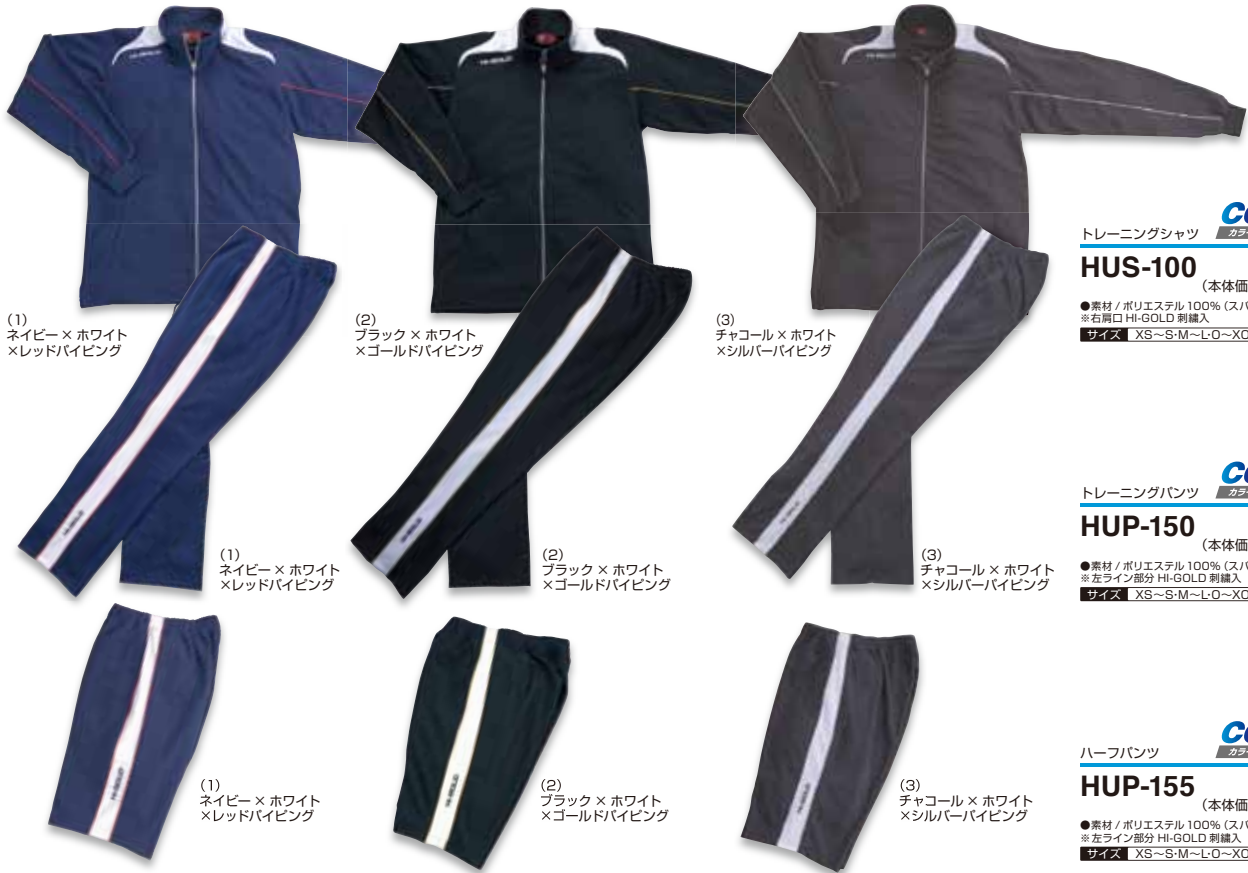
(1) ネイビー×ホワイト×レッドパイピング

導水層であるファインファイバー層の毛細管作用により、汗を素早く生地表面に移行し、拡散層で広げ蒸発させます。汗の逆流が無いので、肌側にはほとんど汗が残らない高度な吸汗・発散メカニズムを持つ特殊な多層構造ニット素材です。